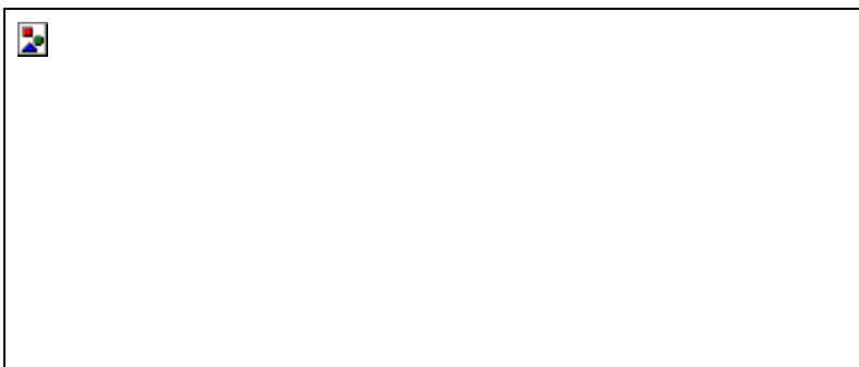
СРАВНИТЕЛЬНАЯ ТАБЛИЦА СТИЛЕЙ 1